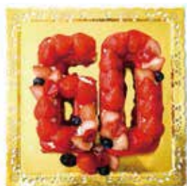
数字の形のオーダーメイドケーキ。 お好みの旬のフルーツをトッピングして あなただけのケーキをお作りください。 賀寿やお誕生日のお祝いに最適です。

また、こちらのコーナーは節季行事や日本独自の賀寿の習慣、水引きや熨斗などの「贈る」形と日本文化を大切にしたいコンセプトショップになっております。